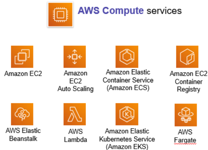
Hình 2.2. Các dịch vụ tính toán của AWS

Nhóm dịch vụ Compute của AWS bao gồm nhiều mô hình khác nhau, từ máy chủ ảo truyền thống (EC2), mô hình tự động mở rộng và cân bằng tải, đến các kiến trúc hiện đại như container và serverless. Sự đa dạng này cho phép AWS đáp ứng nhiều kịch bản sử dụng khác nhau, từ các ứng dụng web đơn giản đến các hệ thống phân tán quy mô lớn.