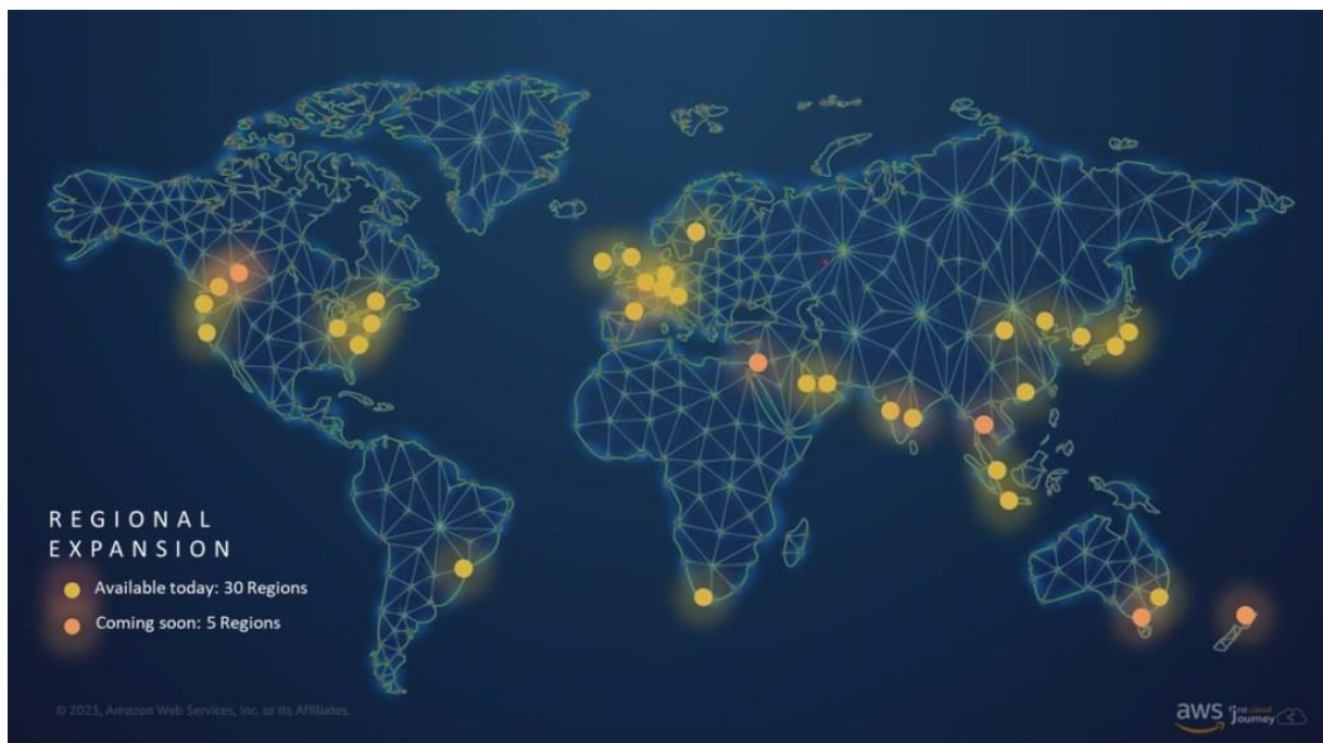
Hình 2.1: Minh họa về hạ tầng toàn cầu của AWS

Hạ tầng toàn cầu (Global Infrastructure) là nền tảng cốt lõi quyết định khả năng mở rộng, độ tin cậy và hiệu suất của Amazon Web Services (AWS). Khác với các mô hình trung tâm dữ liệu truyền thống chỉ tập trung tại một hoặc một vài địa điểm, AWS xây dựng một mạng lưới trung tâm dữ liệu phân tán trên phạm vi toàn cầu. Mô hình này cho phép AWS cung cấp dịch vụ với độ sẵn sàng cao, khả năng chịu lỗi tốt và độ trễ thấp cho người dùng ở nhiều khu vực địa lý khác nhau. Hạ tầng toàn cầu của AWS được thiết kế theo kiến trúc phân tầng, bao gồm Region (khu vực) , Availability Zone (vùng sẵn sàng) và Edge Location (điểm biên) . Mỗi thành phần đóng một vai trò riêng biệt nhưng có mối liên hệ chặt chẽ, tạo thành một hệ thống thống nhất nhằm đảm bảo hiệu năng, tính sẵn sàng và bảo mật cho các dịch vụ đám mây.