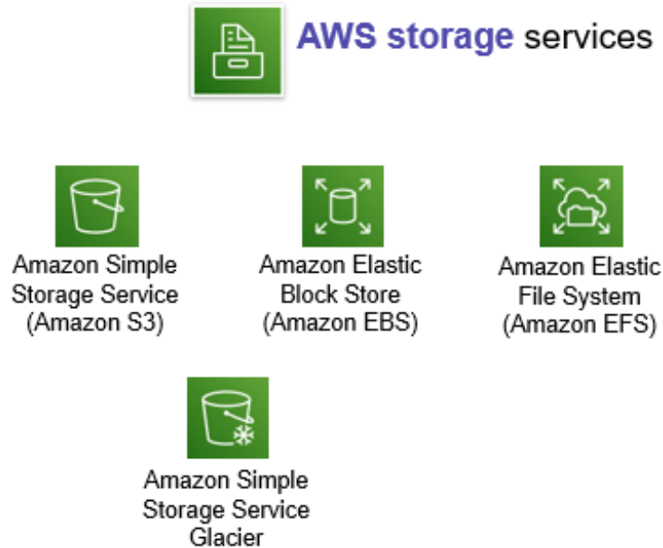
Hình 2.3: Các dịch vụ lưu trữ của AWS Cloud