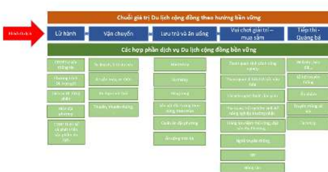
Hình 3.1. Chuỗi giá trị DLCĐ theo hướng bền vững trên đảo Lớn

Chuỗi giá trị chỉ ra các hợp phần dịch vụ chính, các dịch vụ cụ thể mà cộng đồng có thể cung cấp cho du khách khi trải nghiệm, các dịch vụ này được thực hiện theo mục tiêu bền vững. Với các mảng dịch vụ lớn: lữ hành, vận chuyển, lưu trú và ăn uống, vui chơi giải trí và mua sắm, tiếp thị và quảng bá, cụ thể như sau: