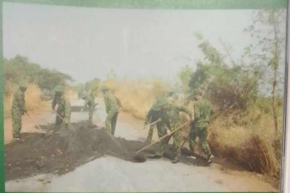
Cán bộ, chiến sĩ Đoàn KT-QP 737 sửa chữa đường giao thông trên địa bàn đóng quân.

khai hoang và bàn giao hơn 2.000 héc-ta đất cho huyện Ea Súp để cấp bổ sung đất sản xuất cho các hộ dân của xã Ia R'vê và Ia Lốp, bảo đảm mỗi hộ có đủ 2 héc-ta đất sản xuất