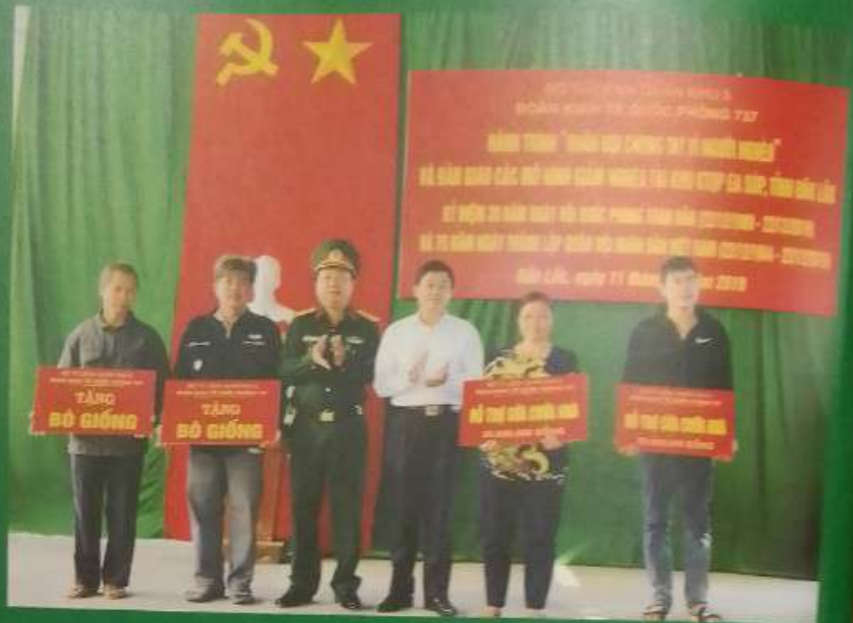
Bàn giao các mô hình giảm nghèo tại khu KT-QP Ea Súp, tỉnh Đắk Lắk.

Xung kích trong phòng, chống thiên tai, tìm kiếm cứu nạn; tích cực tham gia các hoạt động xã hội vì cộng đồng cũng là những nhiệm vụ mà Đoàn thường xuyên coi trọng, được chính quyền địa phương và