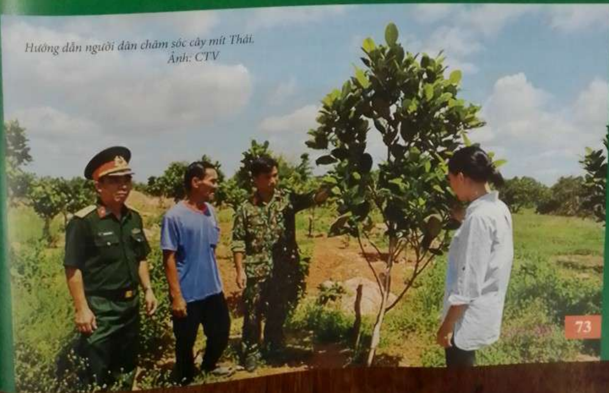
Hướng dẫn người dân chăm sóc cây mít Thái.

thống kênh mương và khoảng 1.000 héc-ta tưới bơm trong mùa khô; đồng thời, điều tiết giảm thoát lũ trong mùa mưa cho các vùng ngập úng. Đoàn cũng phối hợp với UBND huyện Ea Súp lồng ghép chương trình lập dự án xin vốn và tổ chức khai hoang ruộng nước từ nguồn nước kênh Chính Tây cho người dân với diện tích 130 héc-ta. Thực hiện