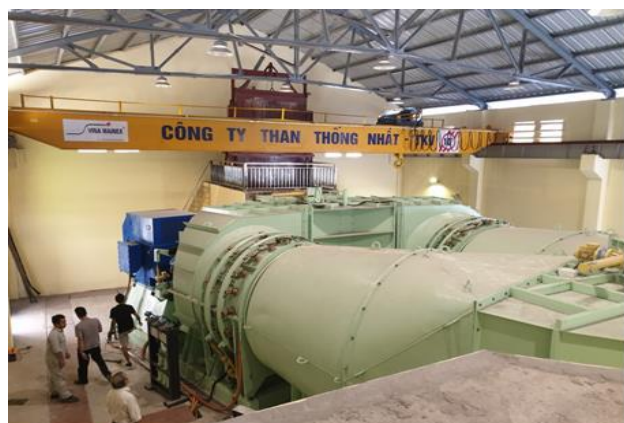
Hình 1. Mặt bằng lắp đặt trạm quạt VO - 22/14 AR.