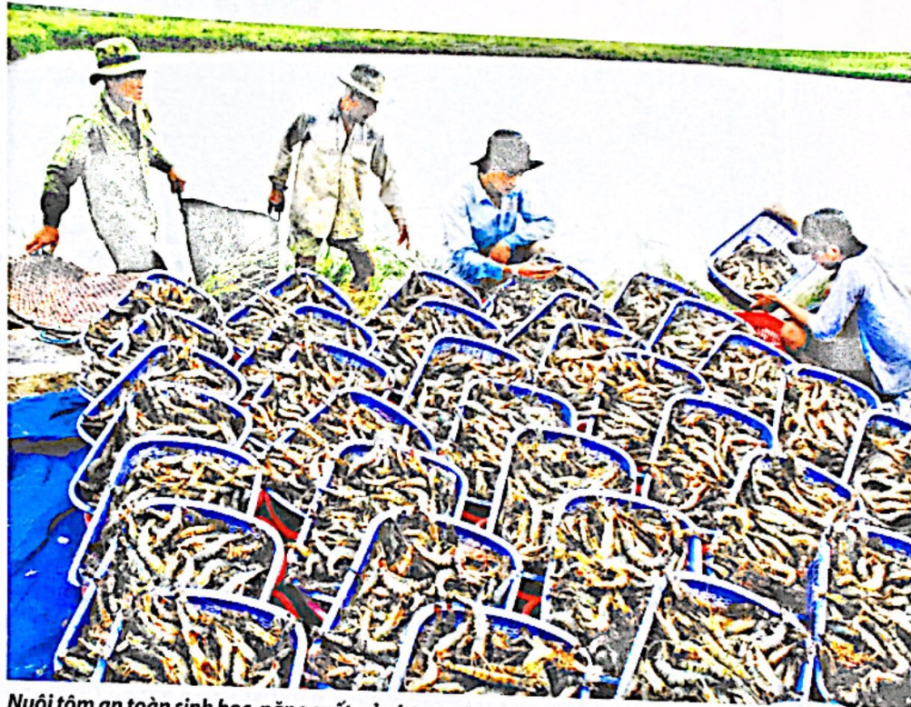
Nuôi tôm an toàn sinh học, năng suất, sản lượng tăng, giúp nông dân tỉnh Cà Mau nâng cao thu nhập.

Đ ạo đức nghề nghiệp là yếu tố cơ bản giúp người làm việc có nhận thức, thái độ và hành vi đúng đắn trong nghề nghiệp để hoàn thành nhiệm vụ của mình theo những tiêu chí mà xã hội đặt ra. Nhờ thực hiện tốt và tuân theo những yêu cầu của đạo đức nghề nghiệp mà chất lượng của quá trình lao động được tăng cường, sản phẩm của lao động đáp ứng được những đòi hỏi của người tiêu dùng và xã hội. Ngược lại, khi những nguyên tắc, chuẩn mực của yêu cầu đạo đức nghề nghiệp không được thực hiện hoặc thực hiện không đúng thì chúng sẽ ảnh hưởng tiêu cực đến chất lượng và hiệu quả của hoạt động nghề nghiệp đó. Vì thế, đạo đức nghề nghiệp giữ vai trò rất quan trọng trong việc nâng cao sự tín nhiệm của mọi người vào nghề nghiệp, là phương thức nhằm củng cố lòng tin của người dân vào các