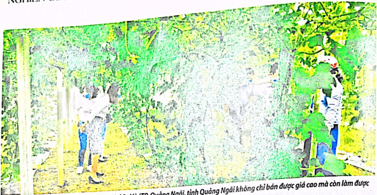
Trồng rau, củ, quả hữu cơ, nông dân xã Nghĩa Hà (TP. Quảng Ngãi, tỉnh Quảng Ngãi không chỉ bán được giá cao mà còn làm được du lịch nông nghiệp.

sản xuất lớn, bao gồm nhiều chuyên ngành: Trồng trọt, chăn nuôi, sơ chế nông sản, theo nghĩa rộng thì nông nghiệp bao gồm cả ngành lâm nghiệp và ngành thủy sản. Đạo đức nghề nông là hệ thống những quan điểm, quy tắc và chuẩn mực hành vi phù hợp với đặc trưng của lĩnh vực nông nghiệp và yêu cầu của xã hội, là động lực phát triển năng lực nghề nghiệp của người lao động và làm tăng năng suất lao động, uy tín của nghề nông nghiệp trong xã hội.