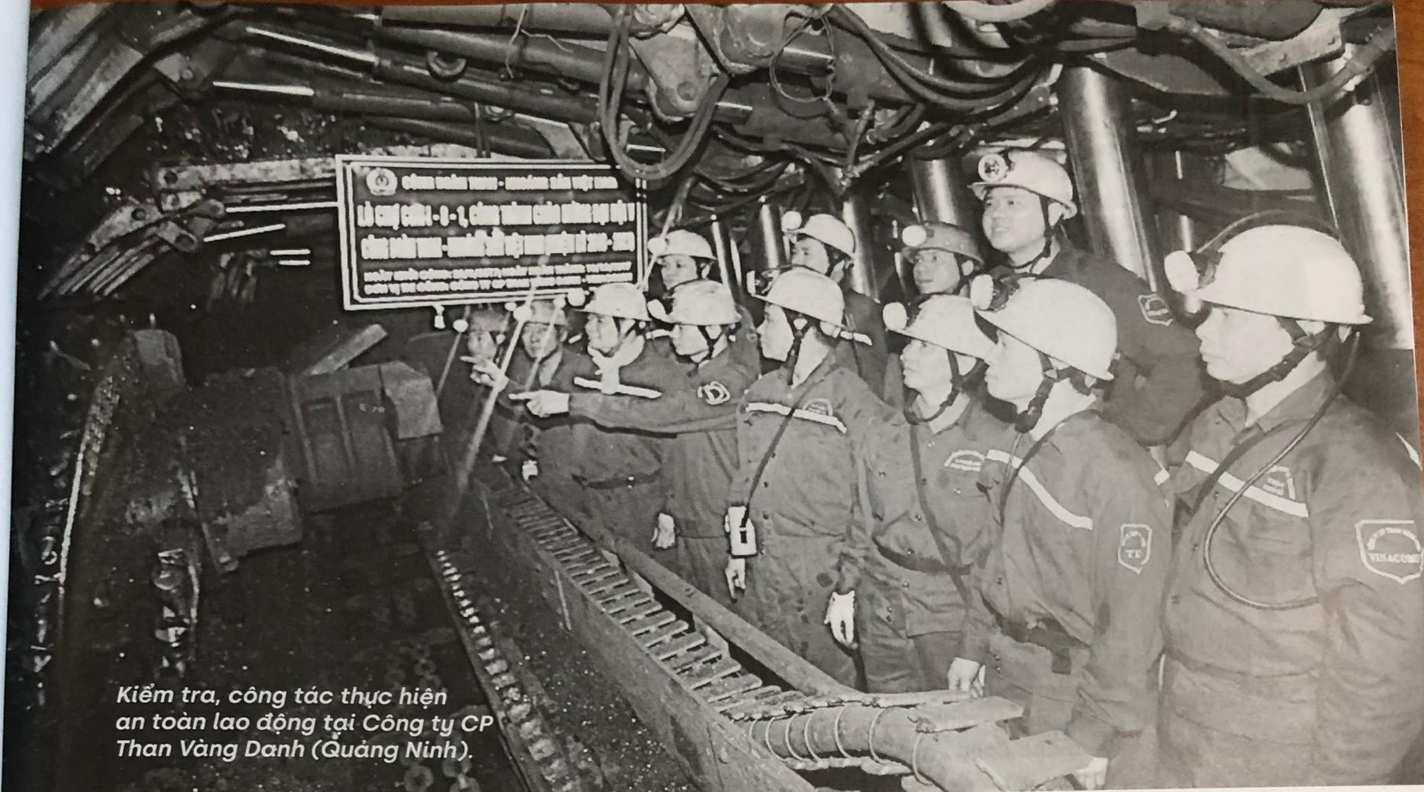
Kiểm tra, công tác thực hiện an toàn lao động tại Công ty CP Than Vàng Danh (Quảng Ninh).