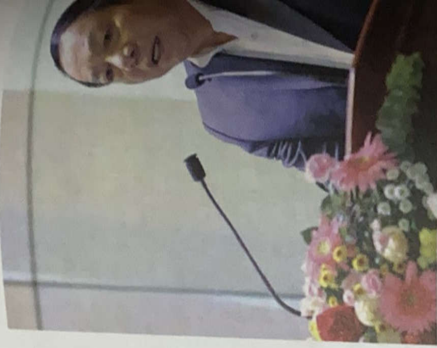
Ông Nguyễn Văn Hùng - Bộ trưởng Bộ VHNTDL