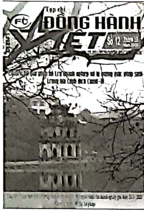
Chú thích ảnh bìa: Tháp Rùa (Hồ Hoàn Kiếm)