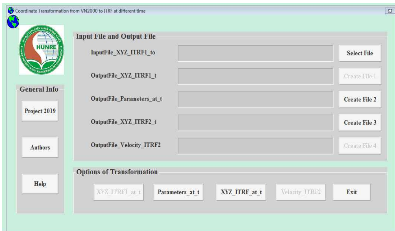
Hình 2. Giao diện thành thực đơn “VN2000_to_ITRF_Diff_Time”.

Phần mềm là một công cụ hữu hiệu để người dùng dễ dàng tích hợp được cơ sở dữ liệu quốc tế và quốc gia trong xu thế phát triển của khoa học công nghệ hiện nay.