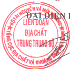
Trần Văn Thảo

Biên bản này được lập thành 06 bản có giá trị pháp lý như nhau, Bên A giữ 04 bản, Bên B giữ 02 bản./.