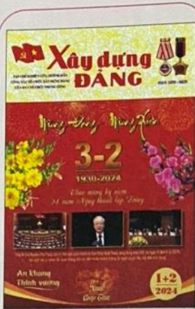
Bìa 1: Mừng Đảng - Mừng Xuân - Mừng Đất nước, Xuân Giáp Thìn 2024.