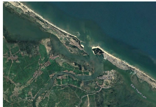
Hình 1: Vị trí khu vực nghiên cứu

yếu đối với cố đô Huế về mặt chiến lược, thương mại, cũng như kinh tế. Bên cạnh đó, hệ đầm phá Tam Giang - Cầu Hai được xem là hệ thống đầm phá lớn nhất Đông Nam Á với diện tích gần 22.000 ha mặt nước, kéo dài 68 km dọc bờ biển của tỉnh Thừa Thiên Huế [15].