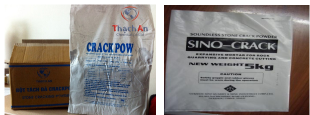
a) Bột nở Thạch An;

Bột nở phá đá (stone cracking powder) là một loại vật liệu dùng để phá khối đá, khối xây gạch đá và khối bê tông [2] mà không cần dùng chất nổ. Áp suất trương nở của bột tăng dần và lớn hơn 300 KG/cm 2 . Lực kháng kéo của đá và bê tông nhỏ hơn cường độ chịu nén của bột nở này hàng chục lần. Với đá chỉ khoảng 40÷80 KG/cm 2 và bê tông chỉ từ 20÷40 KG/cm 2 , nên khối đá và bê tông dễ dàng bị tách phá sau khi khoan lỗ và nạp vữa bột nở phá đá vào [3]