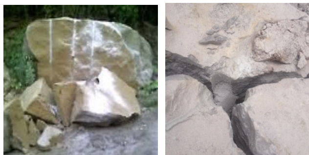
H.2. Khối đá bị phá vỡ khi dùng bột nở [2]

Sử dụng bột nở để phá đá được tiến hành theo các bước sau: khoan lỗ, trộn bột nở thành vữa, nạp vữa vào lỗ khoan, đập lỗ khoan. Sau một khoảng thời gian nạp vữa vào lỗ khoan thì bột nở tăng thể tích làm phát sinh áp lực tác động vào thành lỗ khoan. Nếu ta bố trí mạng các lỗ khoan thích hợp và tính toán được các thông số công nghệ dùng bột nở thích hợp thì khối đá sẽ bị nứt vỡ thành các phần nhỏ theo ý muốn (xem hình H.2).