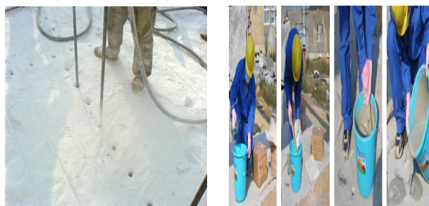
a) Khoan lỗ khoan;

- Trộn bột: Sử dụng một bao 5 kg bột nở với 1,5÷2 lít nước lạnh trộn kỹ, đều và nhuyễn sau đó nạp ngay vào lỗ khoan trong khoảng 5÷10 phút sau khi pha trộn (xem hình H.3.b) [4]. Nước trộn cần sạch không lẫn dầu, tạp chất hữu cơ, nhiệt độ khoảng 20 độ, dùng nước lạnh là tốt nhất.