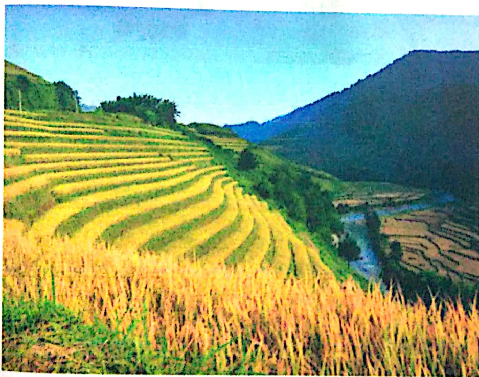
Hà Giang mùa lúa chín

thiểu số Hà Giang để phát triển du lịch cộng đồng đang được chính quyền coi trọng, đẩy mạnh để bảo tồn các giá trị văn hóa, đồng thời qua đó thúc đẩy phát triển các loại hình sinh kế, khôi phục làng nghề truyền thống, quảng bá sản vật và văn hóa địa phương. Với sự quan tâm và đầu tư phù hợp Hà Giang đã thực sự trở thành điểm đến du lịch hấp dẫn của khách du lịch trong và ngoài nước.